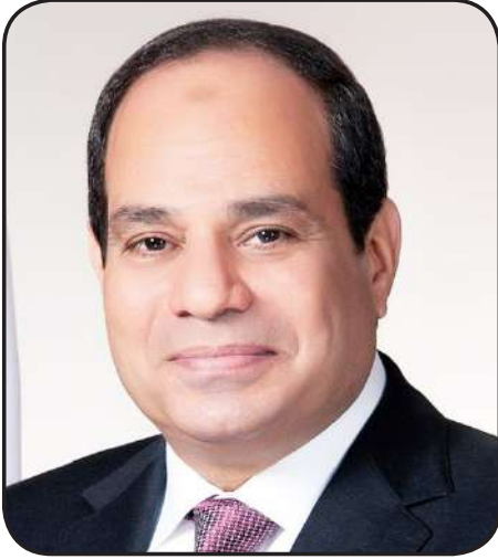
اللواء عادل الغضبان محافظ بورسعيد