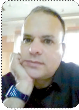
محمد جعفر يكتب