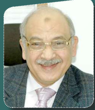
بقلم: سامح نصير سكرتير الاتحاد التعاوني الإنتاجي

✽ دخول دوس في الإسلام، ومبايعة أهل المدينة للرسول، وبداية الهجرة ١ - جاء الطفيل بن عمرو سيد قبيلة دوس للحج، حذرة أهل مكة من محمد وطلبوا منه عدم الاستماع له حتي لا يسحره فوضع الطفيل قطن في أذنه، راجع الطفيل نفسه اثناء الطواف فنزع القطن من أذنه وجلس، طلب صلى الله عليه وسلم ان يستمع له فأستمع وبعد ان فرغ صلى الله عليه وسلم من كلامه اسلم سيد دوس وأعتبر ذلك فتحا وفرح صلى الله عليه وسلم به، هاجت قري وهددوا الطفيل لكنه أصر، خافت منه قريش ثم طلب من الرسول صلى الله عليه وسلم أن يأمره بأي شئ فقال له أذهب وأدعو في قومك فساافر وخلال سفره ظهر نور من وجهه فطلب من الله ان لا يكون في وجهه حتي لا يقول الناس ان ألهه قريش اذته، فانتقل النور إلي طرف سوته، ودعا في قومه فدخلت دوس كلها في الإسلام. ٣ - انتشر الإسلام بالمدينة وفي العام الثالث قبل الهجرة أرسلت المدينة في موسم الحج وفد ضم ثلاثة وسبعون رجل وأمرأتين من المسلمين بالإضافة إلي عدد من الكفار اللذين كانوا يحجون أيضا، أثناء الحج طلبوا اللقاء مع النبي صلى الله عليه وسلم فأرسلوا إلي النبي صلى الله عليه وسلم رجلين هما البراء بن معرور، سعد بن مالك، سعد كان شاعرا ودخوله في الإسلام أسعد الرسول صلى الله عليه وسلم لتأثير الشعراء في الدعاية في ذلك الوقت لأن بإسلامه سوف ينقل الدعوة بشكل كبير، تم الاتفاق علي موعد مع الرسول للقاء مع الوفد وأصر العباس وهو كافر علي الحضور، وتم اللقاء وطلب منهم صلى