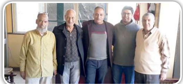
جانب من أعضاء مجلس الإدارة والجهاز الإداري