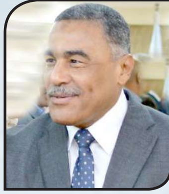
اللواء خالد شعيب محافظ مطروح