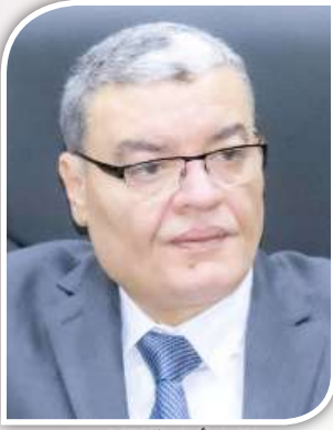
اللواء أسامة القاضي محافظ المنيا