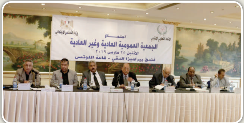
رئيس الاتحاد وأعضاء مجلس الإدارة أثناء انعقاد الجمعية العمومية لتعديل اللوائح الإدارية

وقد خرج مؤتمر «الغردقة» بعدة توصيات لعل أهمها ضرورة تطبيق مبدأ «التعاون بين التعاونيات» الذي قال عنه رئيس الاتحاد العام للتعاونيات بأنه السبيل الوحيد لانطلاق الحركة التعاونية المصرية في ظل ما تعانيه من تجاهل بعض المسؤولين الحكوميين.