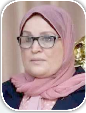
سوسن حبيش وكيل وزارة التضامن ببورسعيد