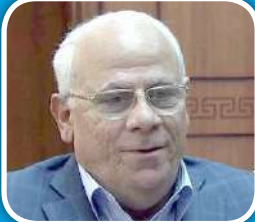
اللواء عادل الغضبان محافظ بورسعيد