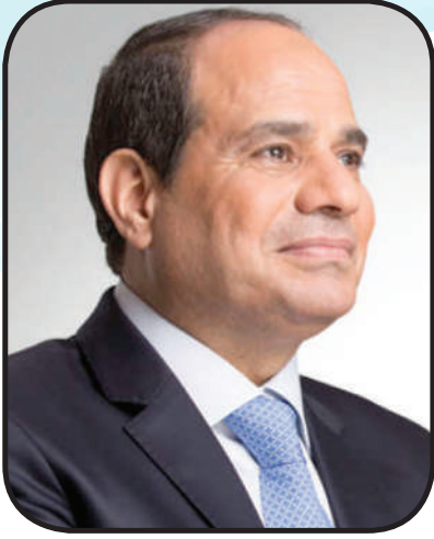
اللواء عادل الغضبان محافظ بورسعيد