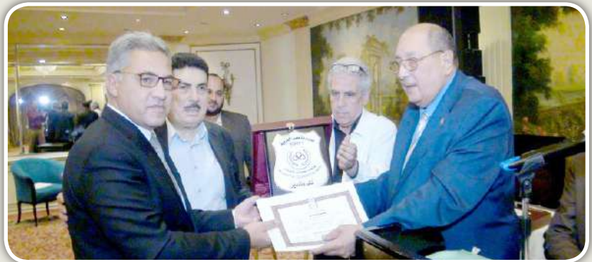
م. أحمد السجيني رئيس لجنة الإدارة المحلية بالبرلمان يتسلم درع التكريم