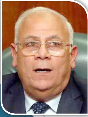
اللواء عادل الغضبان محافظ بورسعيد